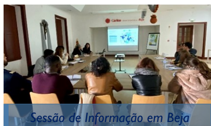
Sessão de Informação em Beja

A OIM participou ainda no X Estágio de Inspetores da Carreira de Investigação e Fiscalização do Serviço de Estrangeiros e Fronteiras onde, entre outros temas, se apresentou o projeto ARVoRe VII e se falou do trabalho conjunto com o SEF em matéria de retorno voluntário assistido. Participaram na sessão os 138 formandos .