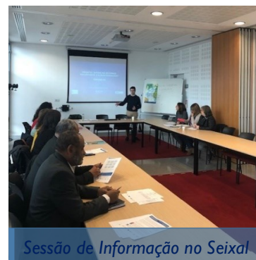
Sessão de Informação no Seixal

Para além das habituais atividades de aconselhamento, retorno, e apoio à reintegração, a equipa do programa ARVoRe VII também promoveu sessões de informação e esclarecimento para técnicos nas várias regiões do país, com o objetivo de esclarecer dúvidas e perceber melhor as necessidades locais a nível de retorno voluntário.